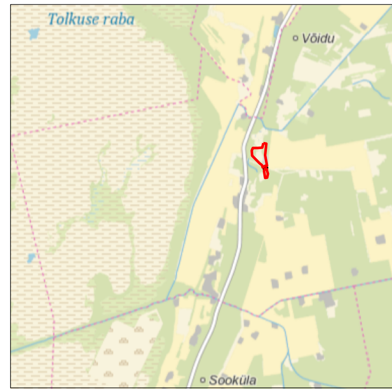
Kaardilehe nr 5314 (Häädemeeste)